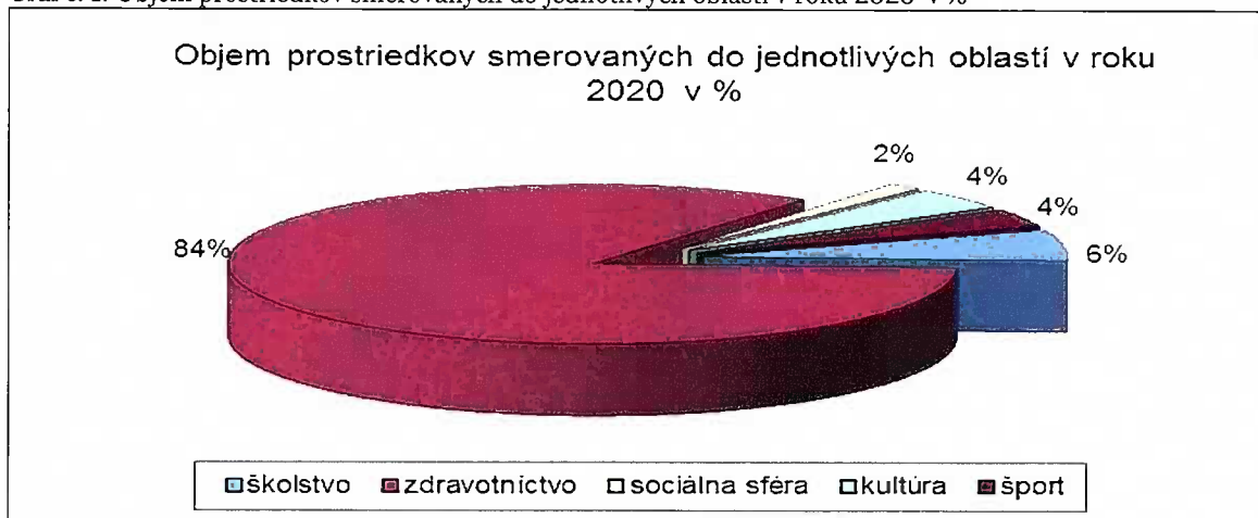
Graf č. 1: Objem prostriedkov smerovaných do jednotlivých oblastí v roku 2020 v %